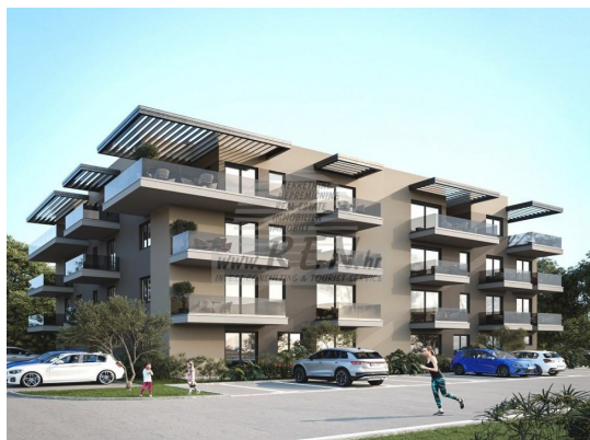
TLOCRT 3. KATA M 1:100